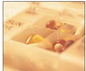
oft sehr teuer

Auch hier ersetzt die gesetzliche Krankenversicherung nur einen geringen Teil der entstandenen Kosten. Unser Reiseschutz ersetzt Ihnen die Medikamentenkosten ab einem Refundierungsbetrag von € 50,00 aufwärts in voller Höhe, sofern Sie eine ärztliche Verschreibung, auf der Name, Adresse und Geburtsdatum des Patienten vermerkt sind, vorlegen können. In "Eigenregie" gekaufte Medikamente können leider nicht ersetzt werden.