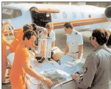
von Krankenhaus zu Krankenhaus

Dieser ist nach einem genormten Schema festgelegt, das in sieben Stufen eingeteilt ist, wobei z.B. Stufe 1 eine geringfügige Verletzung/Erkrankung bezeichnet und die Skala bis zu einer lebensgefährlichen Verletzung oder Erkrankung (Intensivstation) reicht. Somit ist der Schweregrad entscheidend für die Wahl des geeigneten Transportmittels und des Transportzeitpunktes. Dieser wird jedenfalls in Ihrem Interesse und zum medizinisch ehestmöglichen Termin wahrgenommen.