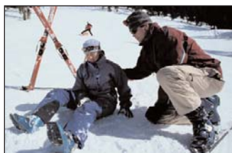
Sturz mit Folgen ...

Nachdem die Leistungsverrechnung bei Primärrettungseinsätzen mit Hubschraubern zunehmend mit dem Verletzten direkt - also privat - erfolgt, erhalten Sie als Inhaber einer Reiseschutzkarte bei Sport- oder Freizeitunfall einen Kostenersatz von bis zu € 1.100,00 rückerstattet.