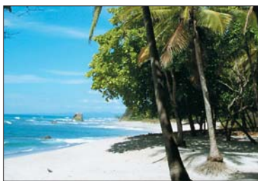
wieder zurück ins Urlaubsparadies

Ein mitreisender Angehöriger wird in einem ausländischen Krankenhaus stationär aufgenommen und eine Heimholung ist aus medizinischen Gründen erst in einigen Tagen möglich. Sie als Begleitperson wollen verständlicherweise vor Ort bleiben. Wir ersetzen die unplanmäßigen, also zusätzlich entstehenden, Kosten für Hotelübernachtungen vor einem Krankentransport (oder einer Überführung). Hierfür stehen pro Tag € 75,00, insgesamt bis zu maximal € 375,00 zur Verfügung.