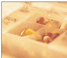
oft sehr teuer

Auch hier ersetzt die gesetzliche Krankenversicherung ebenfalls nur einen geringen Teil der entstandenen Kosten. Unser Reiseschutz ersetzt Ihnen die Medikamentenkosten ab einem Refundierungsbetrag von € 50,00 aufwärts in voller Höhe, sofern Sie eine ärztliche Verschreibung, auf der Name, Adresse und Geburtsdatum des Patienten vermerkt sind, vorlegen können. In "Eigenregie" gekaufte Medikamente können leider nicht ersetzt werden.