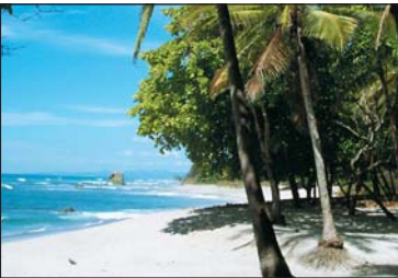
wieder zurück ins Urlaubsparadies

Ein mitreisender Angehöriger wird in einem ausländischen Krankenhaus stationär aufgenommen und eine Heimholung ist aus medizinischen Gründen erst in einigen Tagen möglich. Sie als Begleitperson wollen verständlicherweise vor Ort bleiben. Wir ersetzen die unplanmäßigen, also zusätzlich entstehenden, Kosten für Hotelübernachtungen vor einem Krankentransport (oder einer Überführung). Hierfür stehen pro Tag € 75,00, insgesamt bis zu maximal € 375,00 zur Verfügung.