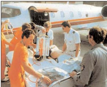
von Krankenhaus zu Krankenhaus

Dieser ist nach einem genormten Schema festgelegt, das in sieben Stufen eingeteilt ist, wobei z.B. Stufe 1 eine geringfügige Verletzung/Erkrankung bezeichnet und die Skala bis zu einer lebensgefährlichen Verletzung oder Erkrankung (Intensivstation) reicht. Somit ist der Schweregrad entscheidend für die Wahl des geeigneten Transportmittels und des Transportzeitpunktes. Dieser wird jedenfalls in Ihrem Interesse und zum medizinisch ehestmöglichen Termin wahrgenommen.