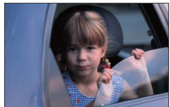
so kommen alle gut nach Hause

Erkrankt der Lenker eines Pkws in Kontinentaleuropa so schwer, dass eine Heimholung durchgeführt werden muss, bringt ein erfahrener Berufschauffeur den Wagen in die Heimat zurück. Diese Kosten werden in voller Höhe übernommen.