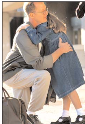
endlich zu Hause

Sie erleiden im Ausland eine Erkrankung oder Verletzung. Ein medizinisch begleiteter Rücktransport ist nicht nötig - die weitere Behandlung wäre jedoch zweckmäßiger in Österreich durchzuführen. Eine Entscheidungshilfe gibt unsere medizinische Einsatzzentrale . Diese organisiert auch Ihre Umbuchung oder die Ausstellung eines neuen Rückflugtickets (das bestehende Reisedokument verbleibt bei uns) zum nächstmöglichen Zeitpunkt. Diesbezügliche Kosten werden bis € 1.500,00 ersetzt. (Leistungserbringung auch bei Vorerkrankung mit Begrenzung)