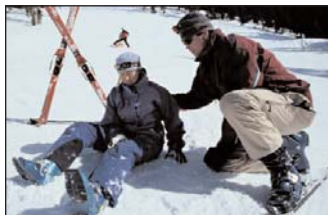
Sturz mit Folgen ...

Nachdem die Leistungsverrechnung bei Primärrettungseinsätzen mit Hubschraubern zunehmend mit dem Verletzten direkt - also privat - erfolgt, erhalten Sie als Inhaber einer Reiseschutzkarte bei Sport- oder Freizeitunfall einen Kostenersatz von bis zu € 1.100,00 rückerstattet.